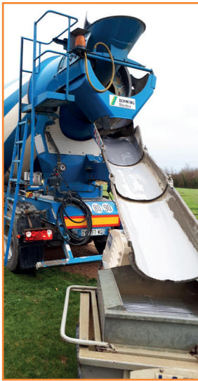
Versement du mélange de la toupie dans la cuve de la pompe