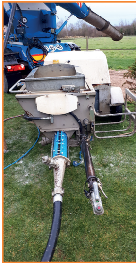
Coulage à la pompe